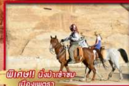
พิเศษ!! นั่งม้าซาฮาบ เมืองเพตรา