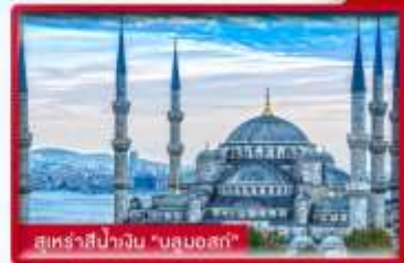
สุเหร่าสีป้าวง "บลูมอสก์"