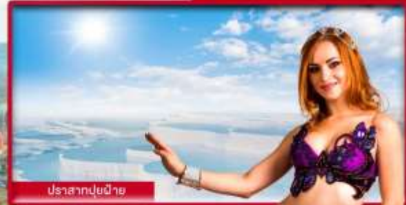
ปราสาทปุยฝ้าย