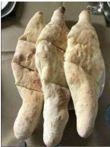
- คาซาบุรี ขนมปังหน้าชีสเยิ้มๆ

“Churchkhela” ขนมหวานทานเล่นที่ขึ้นชื่อ เป็นเม็ดถั่วทองถีนร่อยเข้าด้วยกันเป็นแถวยาวแล้วหุบด้วยแป้งเคี้ยวน้ำตาล