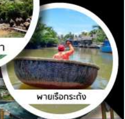
พายเรือกระทิง