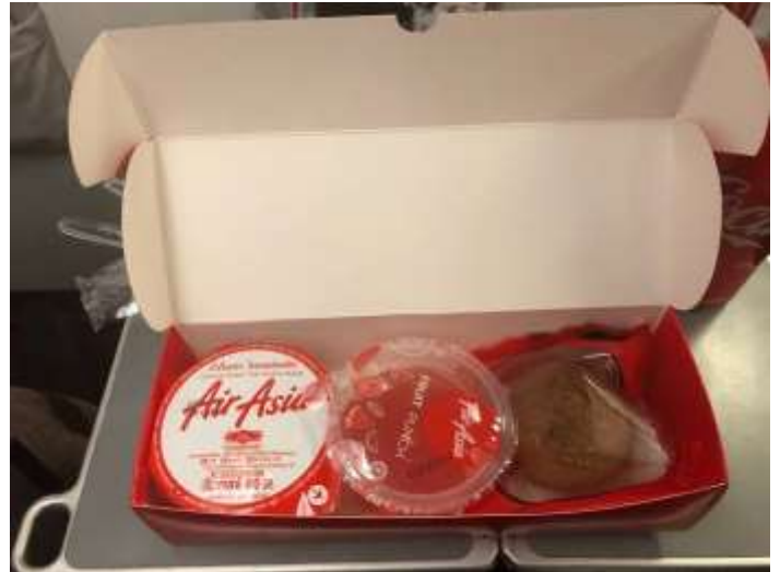
(ภาพตัวอย่าง)