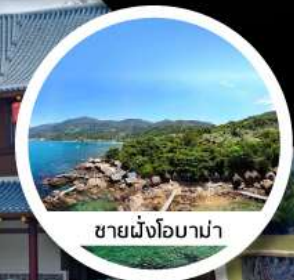
ชายฝั่งโฮมาม่า