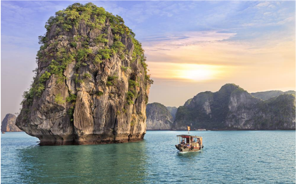
เกาะแมว เกาะไก่ชน ฯลฯ

นำท่านออกเดินทางไปยังท่าเรือ เพื่อล่องเรือชมความงามดั่งภาพวาดของธรรมชาติ ที่ อ่าวฮาตอง ประกอบด้วยหมู่เกาะน้อยใหญ่กว่า 1,900 เกาะ ซึ่งได้รับการประกาศเป็นมรดกโลก โดยองค์การยูเนสโกอ่าวแห่งนี้เต็มไปด้วยภูเขาหินปูนมากมาย ระหว่างการล่องเรือท่านจะได้ชมความงามของเกาะต่างๆ ทั้งเกาะหมา