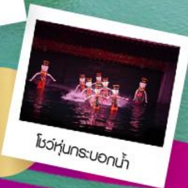
โชว์หุ่นกระบอกน้ำ