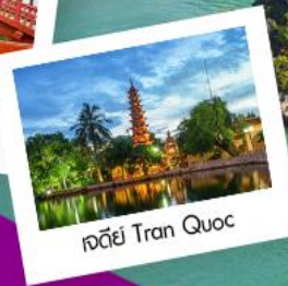
เจดีย์ Tran Quoc