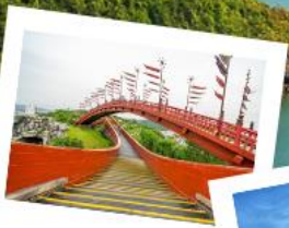
สะพานฮงก๊วย