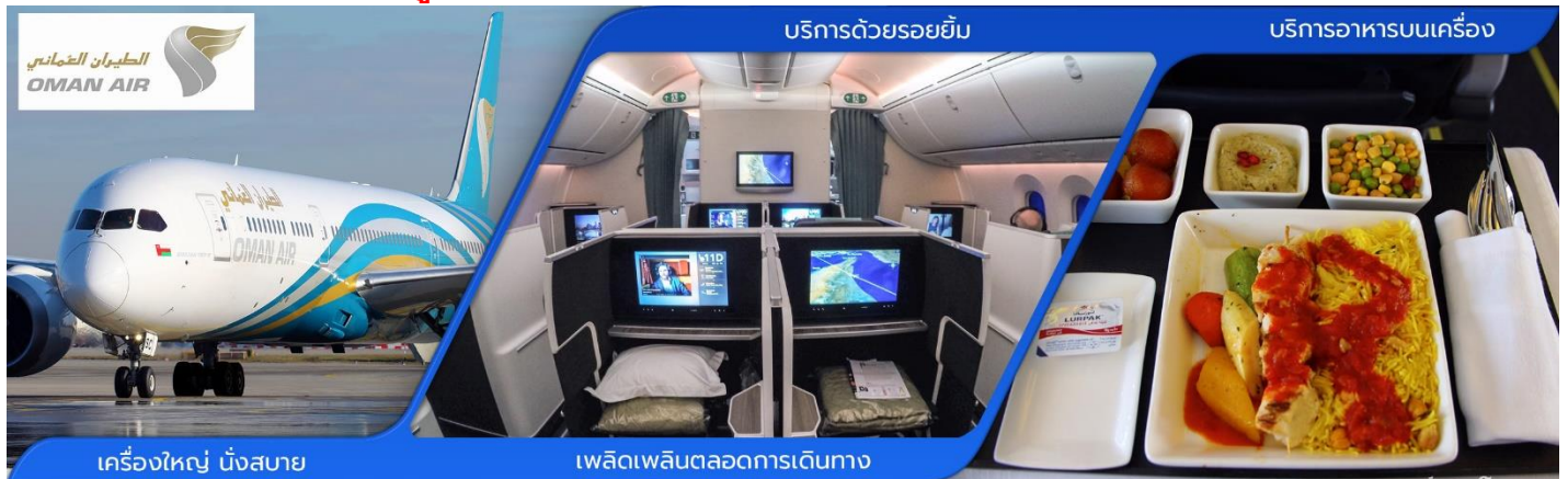
เครื่องบิน นิ่งสบาย

📍 นำท่านเข้าสู่ที่พัก ISTANBUL QUA HOTEL หรือเทียบเท่า