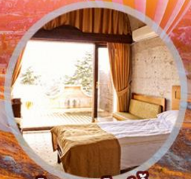
โรงแรมสไตล์ถ้ำ