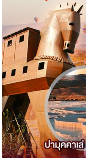
ปามุคคาเล่