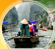
นิงห์บิงห์