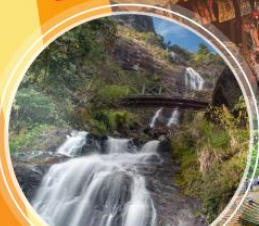
น้ำตกสีเงิน