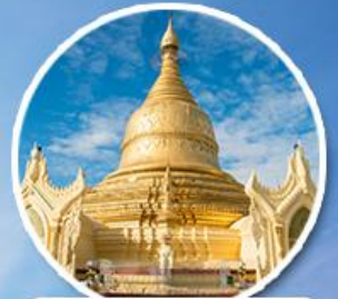
เจดีย์มหาวิชัย