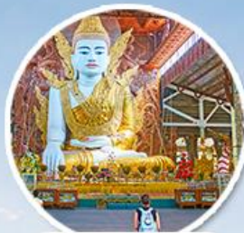
วัดจากัดจี