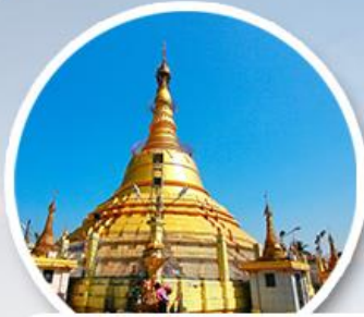
เจดีย์โบตาทาวน์