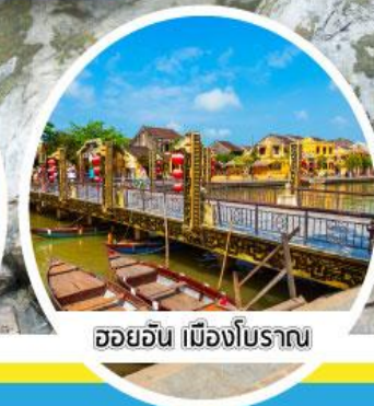
ฮอยอัน เมืองโบราณ