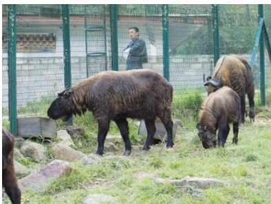
เพียงในแถบเทือกเขาหิมาลัยเท่านั้น

หลังจากอาหารกลางวันเราจะพาท่านไปยัง พระใหญ่ หรือ Great Buddha Dordenma เป็นรูปหล่อพระสัมมาสัมพุทธเจ้าซึ่งสร้างขึ้นในปี 2006 โดยมีความสูง 54 เมตร จากจุดนี้ท่านจะเห็นเมืองทิมพูอย่างชัดเจน ไม่ไกลกันเราจะพาท่านไปยัง ศูนย์อนุรักษ์สัตว์ประจำชาติทาकिन ซึ่งด้านในจะมีตัวทาकिनซึ่งเป็นสัตว์หายากมี