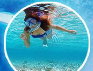
Sand Bank ชมหาดทรายขาว ดำน้ำชมปะการัง