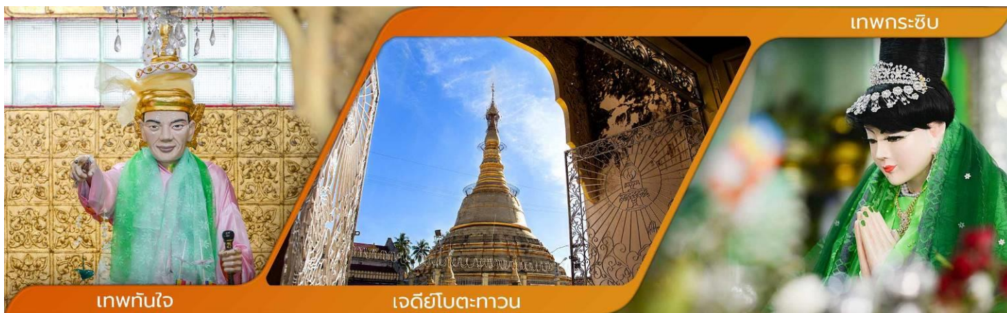
เทพทันใจ

นำท่านขอพร เทพทันใจ หรือ นัตโบโบยี เทพเจ้าศักดิ์สิทธิ์ของชาวพม่าและชาวไทย นัตโบโบยี ก็คือ "นัต" หรือวิญญาณเทพผู้คุ้มครองสถานที่ตามความเชื่อของชาวพม่า โดยเทพที่จะถูกจัดว่าเป็น "นัต" นั้น มักจะเป็นคนที่เคยสร้างคุณงามความดี หรือมีวีรกรรมน่าประทับใจ และมาตายลงด้วยเหตุร้ายแรงที่เรียกว่า ตายโหง ทำให้วิญญาณยังมีความห่วงใยในภาระหน้าที่บ้านเมือง และยังคงผูกพันกับผู้คนเบื้องหลัง ทำให้ไม่อาจไปเกิดใหม่ได้ จึงกลายเป็นนัตที่มากอยคุ้มครองรักษาบ้านเมือง หรือสถานที่ศักดิ์สิทธิ์ เช่น พระเจดีย์องค์สำคัญ