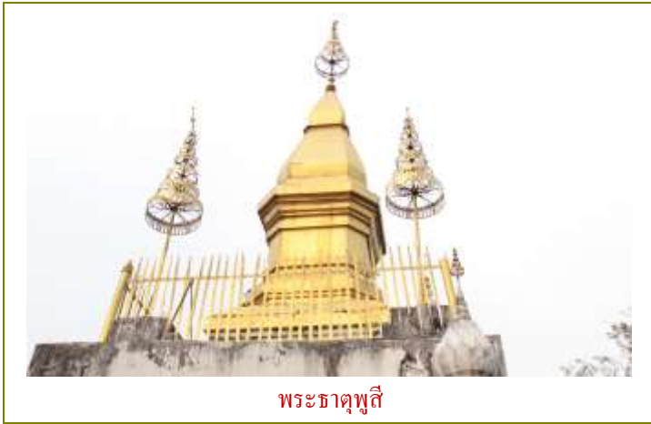
พระธาตุพูลี