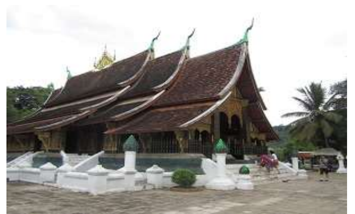
วัดเชียงทอง