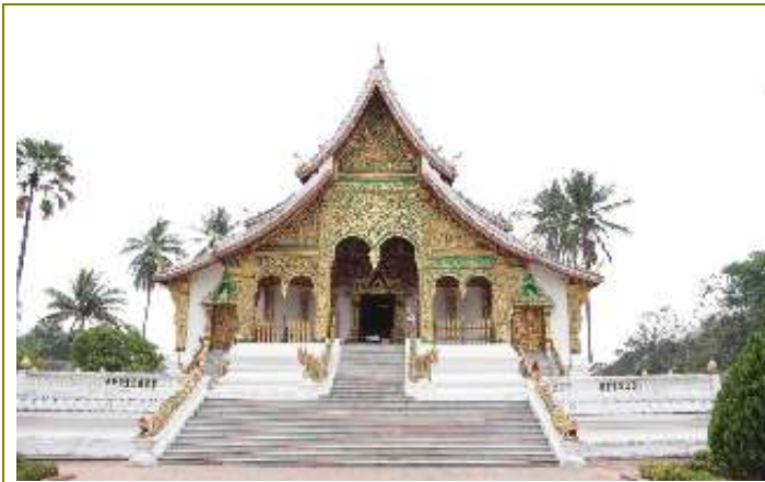
พระราชวัง และ หอพิพิธภัณฑ์หลวงพระบาง