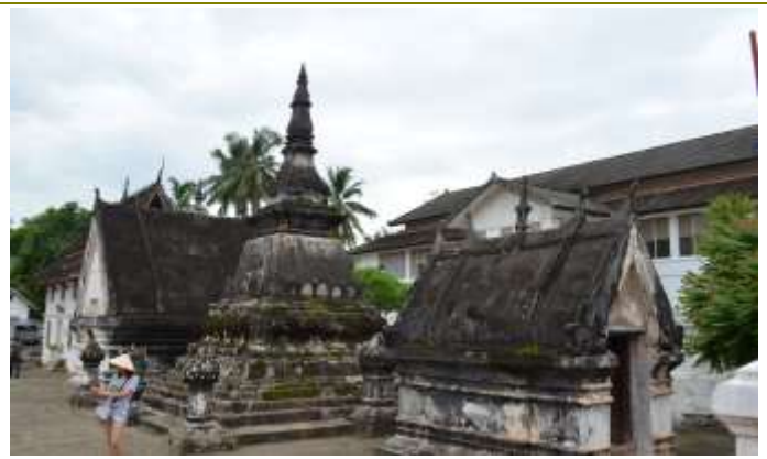
วัดใหม่สุวรรณภูมิราม