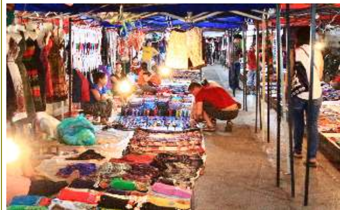
บรรยากาศตลาดกลางคืน