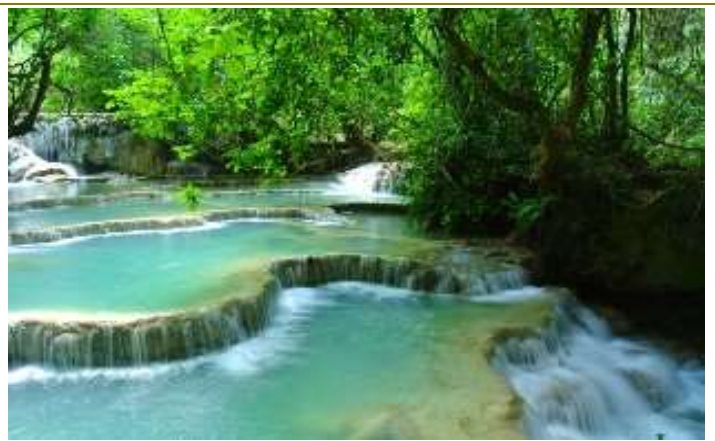
น้ำตกกวางสี