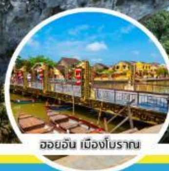
ฮอยอัน เมืองโบราณ