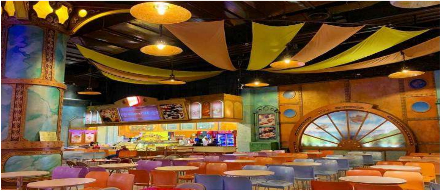
ค่า พักที่ บริการอาหารค่ำ ณ ภัตตาคารบนบาน่า ฮิลล์ อาหารแบบบุฟเฟ่ต์ (5) MECURE BANA HILLS FRENCH VILLAGE บนบาน่าฮิลล์ เป็นรีสอร์ทหรูตั้งอยู่บนเขามาน่า ฮิลล์